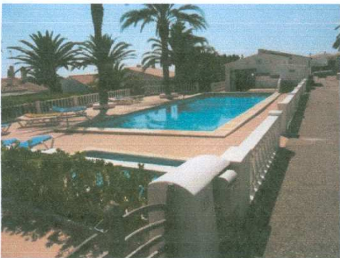
Swimmingpool in der Feriensiedlung Binidali