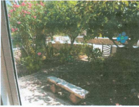
Blick aus dem Wintergarten in den kleinen Vorgarten