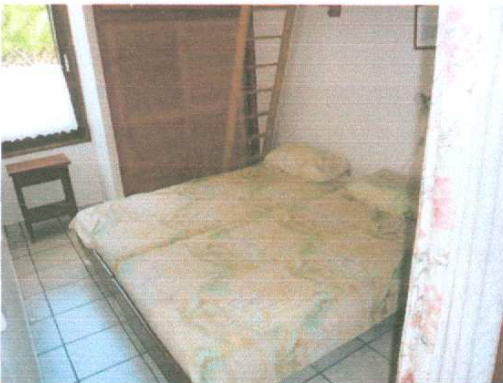
Schlafzimmer mit Galerie untern Ehebett

oben drei zusätzliche Schlafplätze (Massenlagerähnlich)