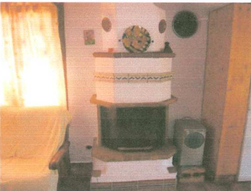
Wohnstube mit integrierter Küche, und Esstisch, mit Sitzecke, Fernseher usw.

Zusätzlich gibt es noch ein Zweierzimmer mit Ehebett